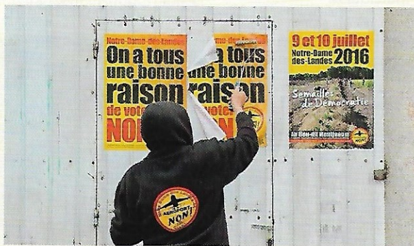
Opposant à la construction de l'aéroport Notre-Dame-des-Landes, juin 2016.

Qu'est-ce donc qu'une majorité prise collectivement, sinon un individu qui a des opinions et le plus souvent des intérêts contraires à un autre individu qu'on nomme la minorité ? Or, si vous admettez qu'un homme revêtu de