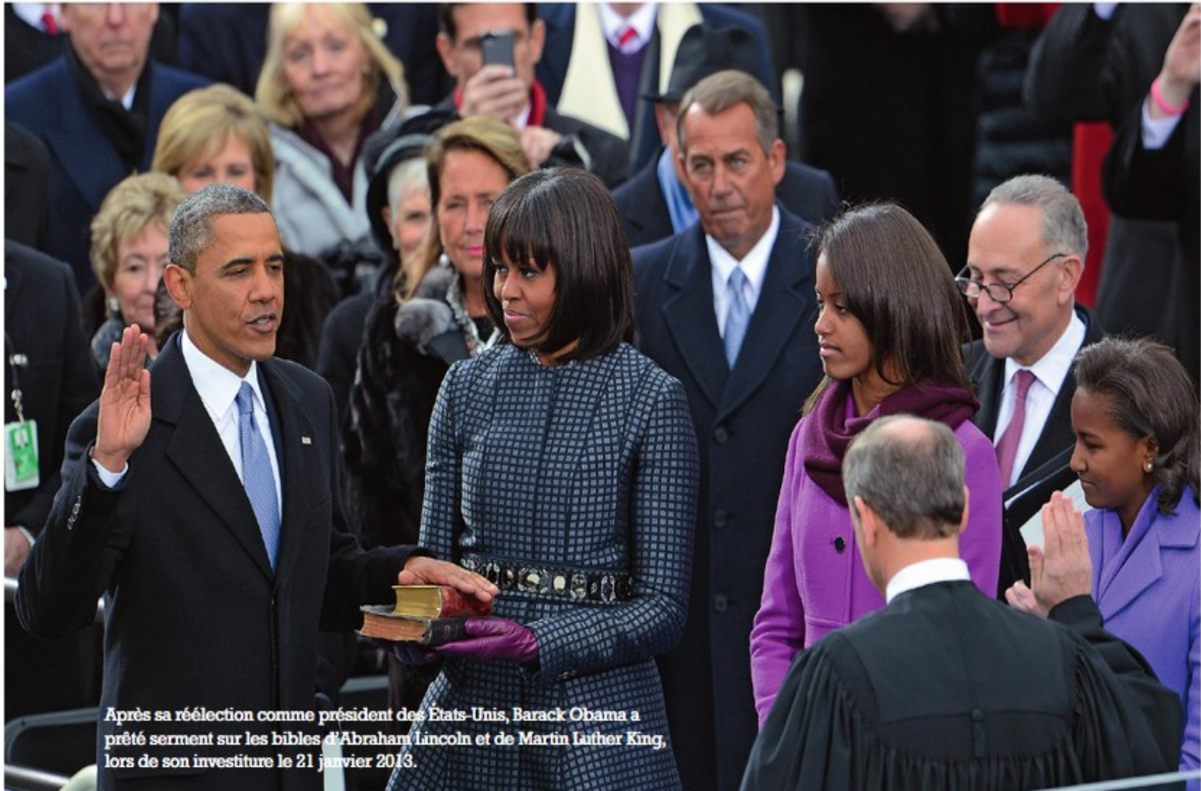
Après sa réélection comme président des États-Unis, Barack Obama a prêté serment sur les bibles d'Abraham Lincoln et de Martin Luther King, lors de son investiture le 21 janvier 2013.