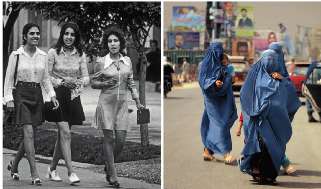
Deux photographies prises en Afghanistan en 1972 et en 2010 : le conflit contre l'invasion soviétique (1979-1988), la guerre civile et le gouvernement des Talibans sunnites (1992-2004), puis l'intervention occidentale contre les Talibans (2003-2014) a poussé chaque camp à utiliser les normes musulmanes sunnites les plus radicales et les pratiques traditionnelles les plus conservatrices pour contrôler la population.

Voyons ces deux photos prise en Afghanistan (on les croit sur paroles). 1972 : jupe courte, mode à la mode, assez occidentale tout ça, rien de très différent avec ce qu'on voit dans d'autres pays... 2010 : burqa, on ne voit rien du corps féminin... toutefois on voit les mains et les pieds...la couverture n'est pas complète...