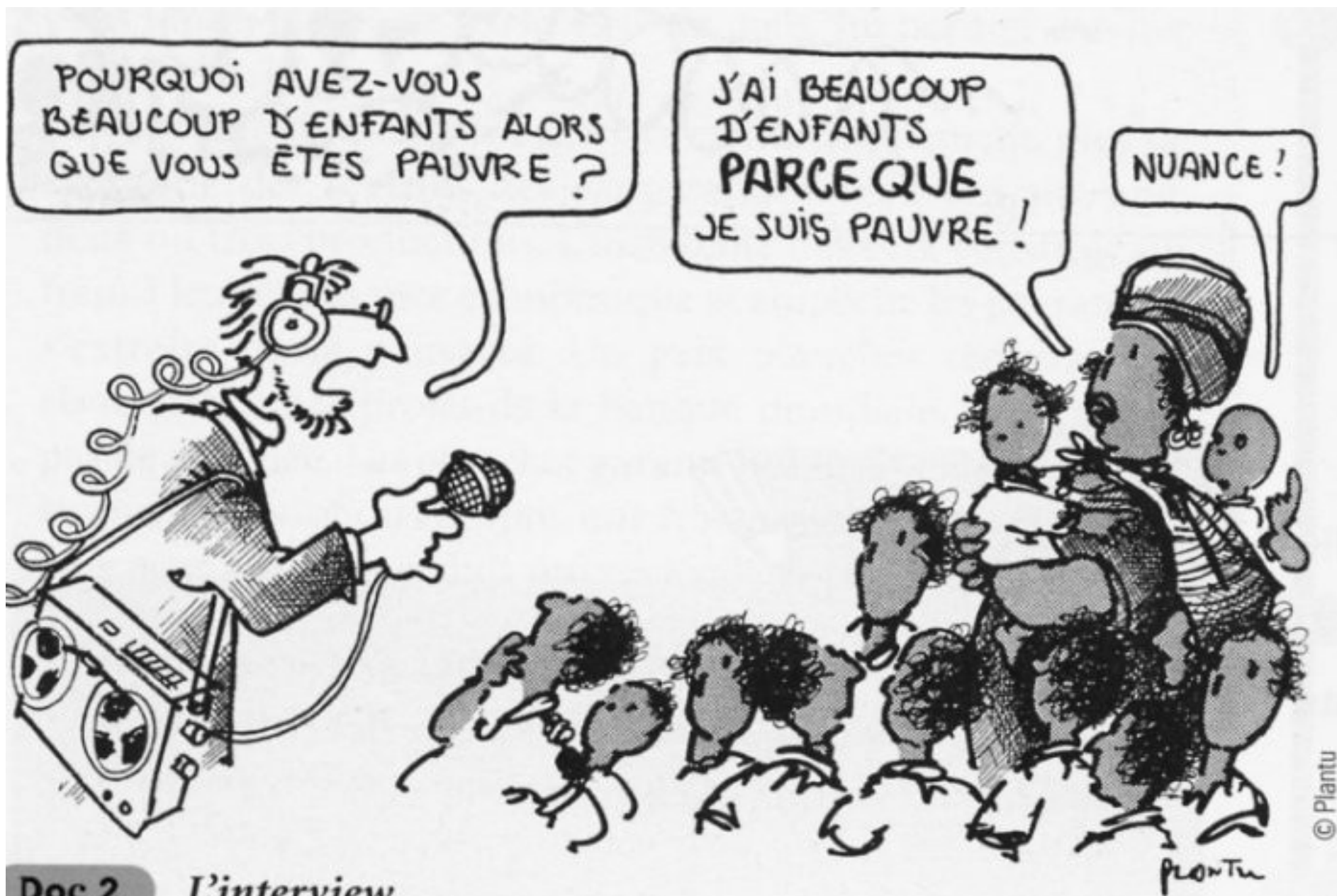
Doc 2 L'interview.