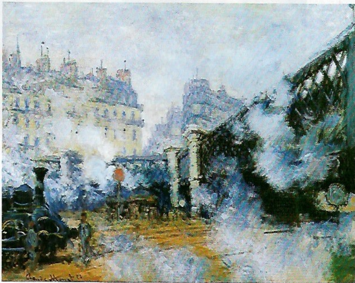
1 Claude Monet, Le Pont de l'Europe, gare Saint-Lazare, 1877 Huile sur toile (64 x 81 cm), Paris, musée Marmottan-Claude Monet.

L'artiste, dans l'expression de son art, est porteur des aspirations et des soucis de l'époque à laquelle il appartient. La lecture artistique de l'œuvre d'art n'exclut pas d'autres lectures, plus ancrées dans l'histoire.