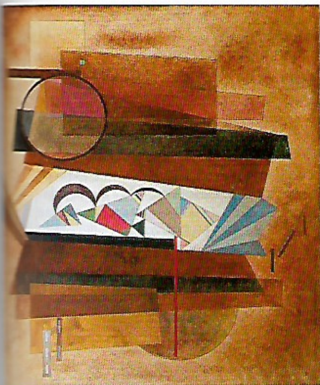
3 Wassily Kandinsky, Développement en brun , 1933. Huile sur toile, (101 x 120 cm). Paris, musée national d'Art moderne, Centre Georges Pompidou.