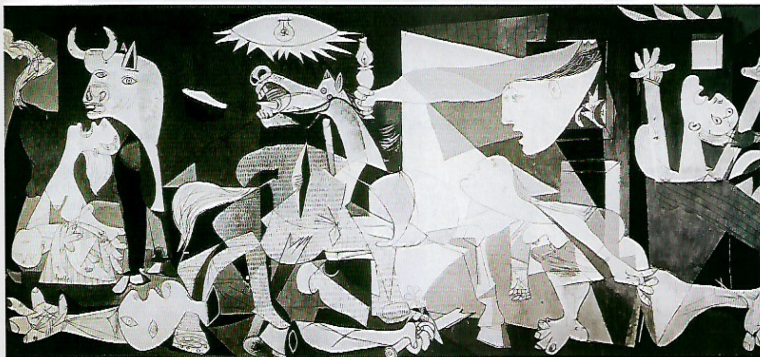
5 Pablo Picasso Guernica , 1937. Huile sur toile (349 x 776,6 cm). Madrid, Centre d'Art Reine Sofia.