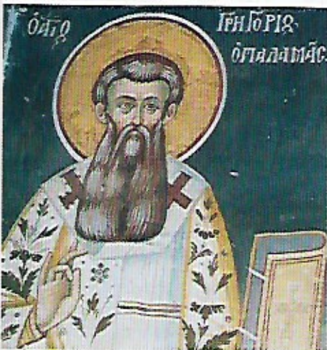
5 Saint Grégoire Fresque, monastère de Xiropotamou, mont Athos.