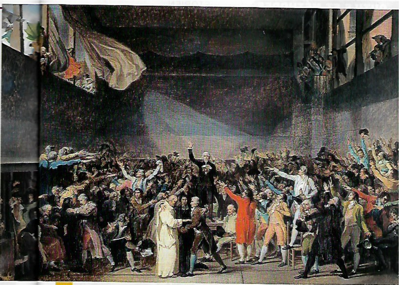
Jacques-Louis David, Le Serment du Jeu de Paume , le 20 juin 1789, huile sur toile, 65x88,7 cm, 1791. Paris, musée Carnavalet.