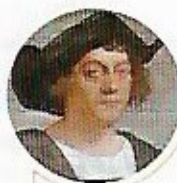
Christophe Colomb (1451-1506)

1. Prêtres chargés d'enseigner la religion chrétienne. – 2. L'islam.