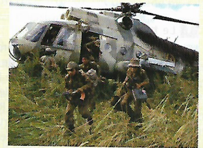
Photo : Soldats de l'armée sandiniste sortant d'un hélicoptère russe