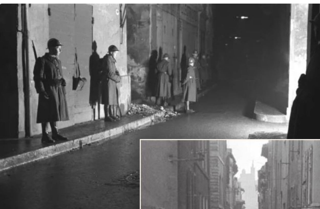
Rafle et évacuation les 22 et 23 janvier 1943