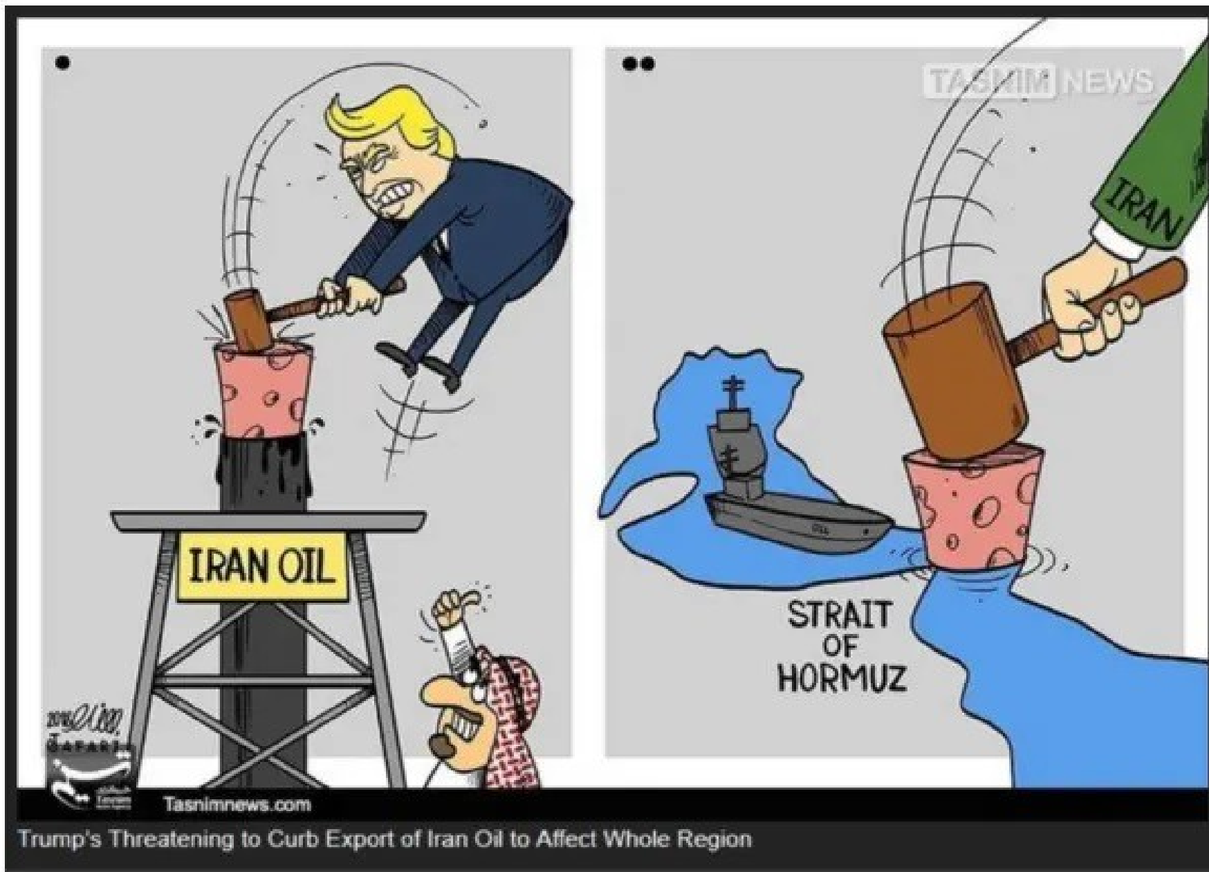
Caricature publiée par l'agence de presse iranienne Tasnim, le 10 juillet 2019