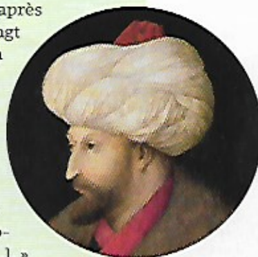
Mehmet II, le conquérant (Portrait du sultan Mehmet II, 1480, huile sur toile, Gentile Bellini, Londres, National Gallery.)

Nicolas de Nicolay, Dans l'empire de Soliman le Magnifique , 1567.