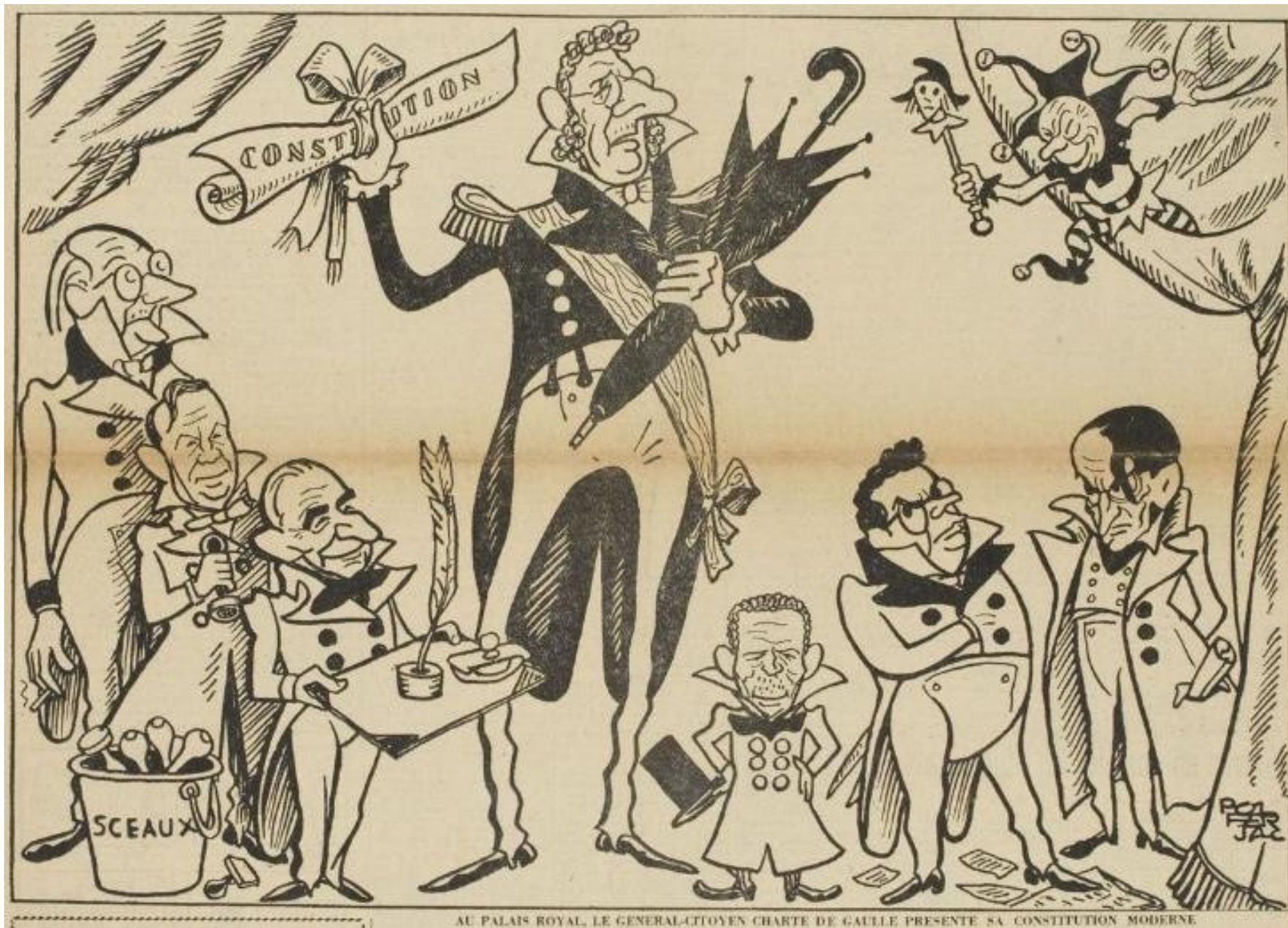
Ferjac, Canard enchaîné, 13 août 1958