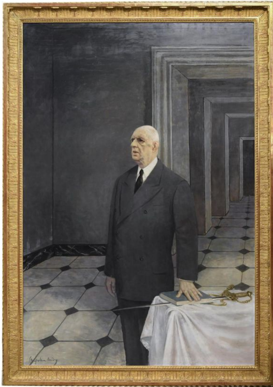
Roger Chapelain-Midy (1904-1992) Portrait du général de Gaulle (1981)