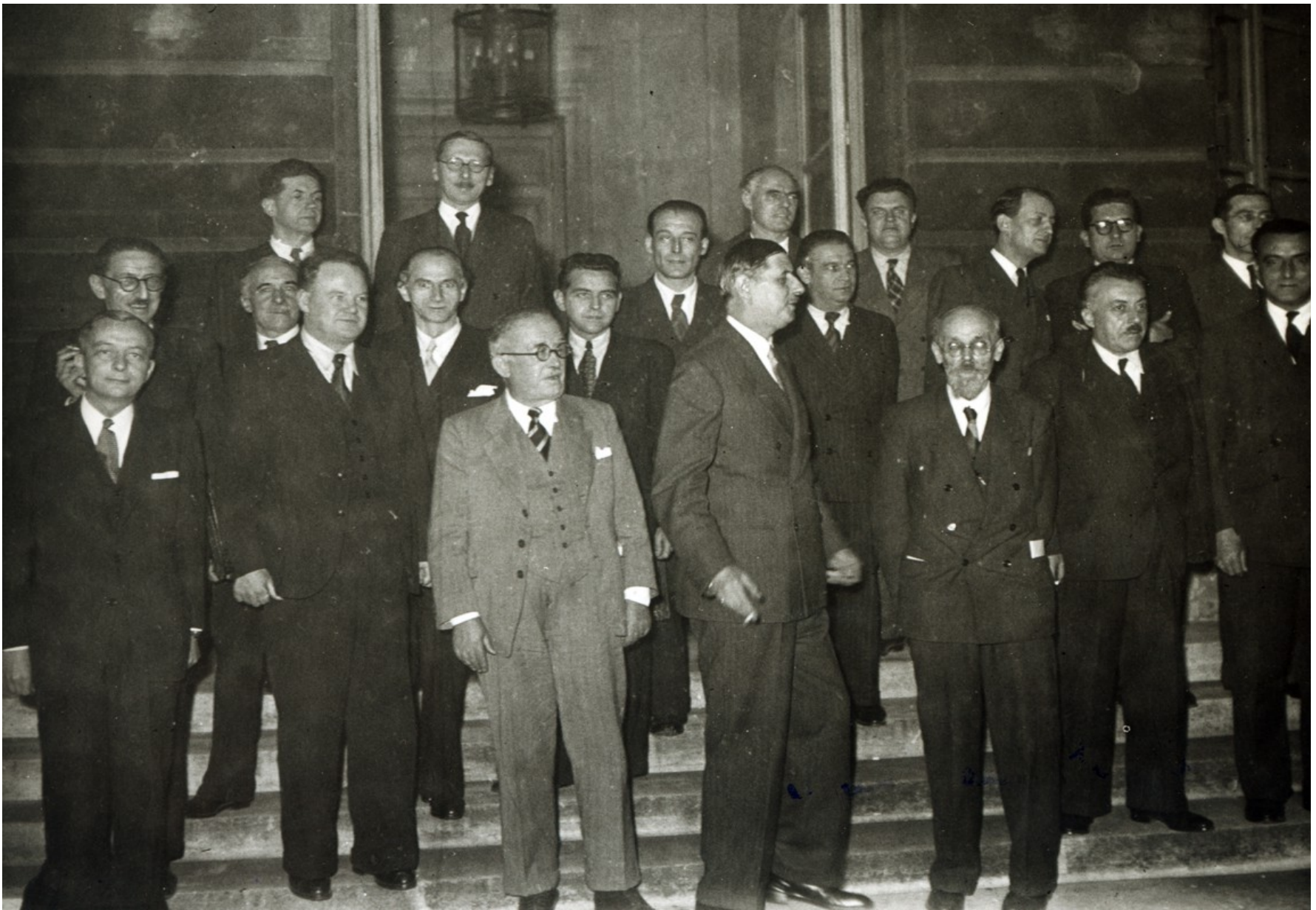
21 novembre 1945, le gouvernement provisoire