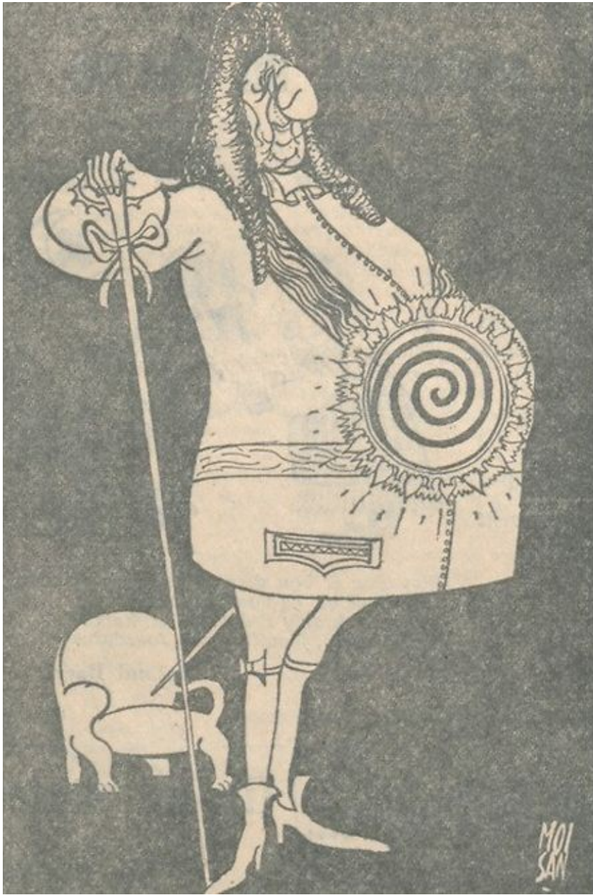
Moisan 11 décembre 1963