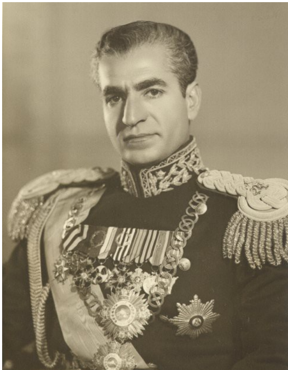
Mohammed Reza Pahlavi 1919-1980 Chah/Shah d'Iran 1941-1979

Déchu par la Révolution Islamique de l'ayatollah Khomeiny de 1979