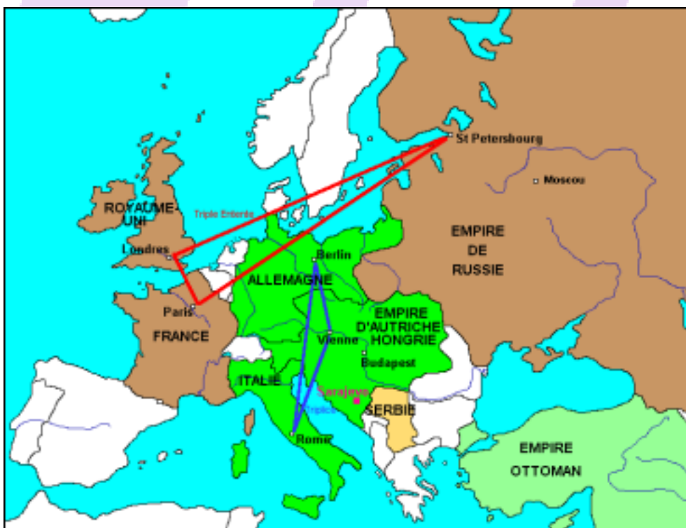
A. HOOOT - Aix-Marseille

. floraison de républiques en 1919-1921 : Allemagne (République de Weimar), Autriche, Pologne, Républiques baltes, Finlande, Eire (aux dépens de la GB), Tchécoslovaquie; régimes théoriquement démocratiques (CZ seule démocratie voulue et solide) qui s'ajoutent à France, Suisse et Portugal et monarchies parlementaires très libérales (GB, royaumes scandinaves, Finlande, Belgique, PB, Luxembourg); Espagne, Italie, Yougoslavie, royaumes balkaniques, Turquie de Mustapha Kemal (1923), "régence" de Hongrie = Etats peu démocratiques avec parlements au pouvoirs réduits et suffrage souvent limité.