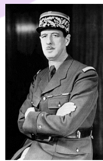
C. de Gaulle