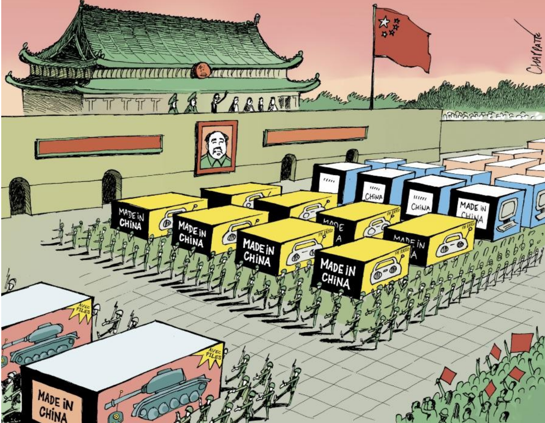
Document 2 : caricature de Patrick Chappatte à l'occasion du 10ème anniversaire de l'entrée de la Chine à l'OMC, "Le temps", Genève, 4 décembre 2011