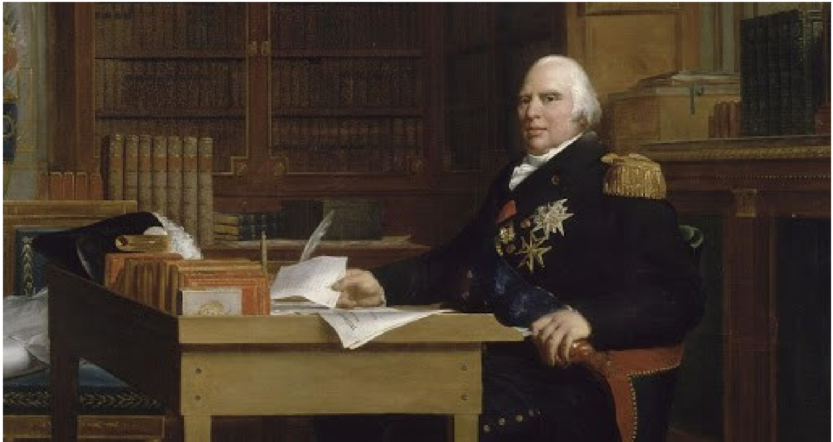
Louis XVIII ( 1755-1824)