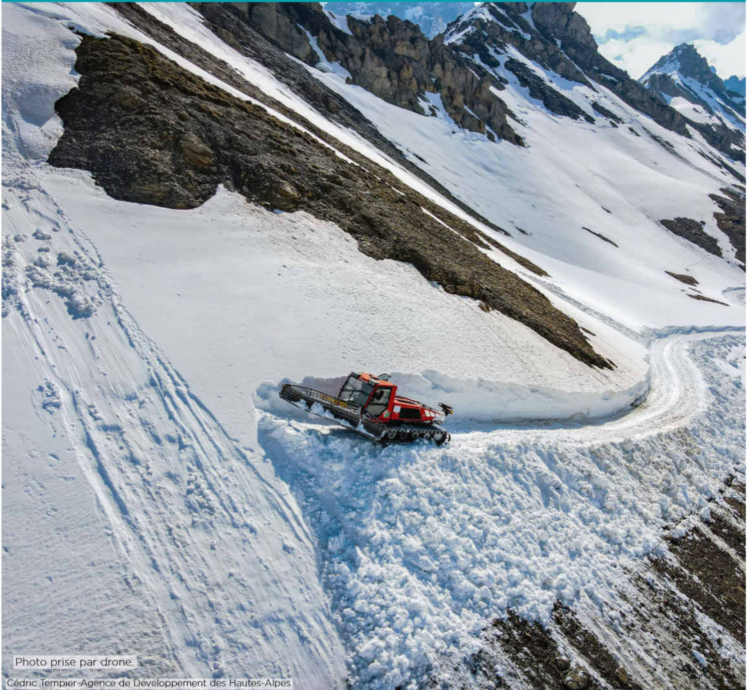
Photo prise par drone.