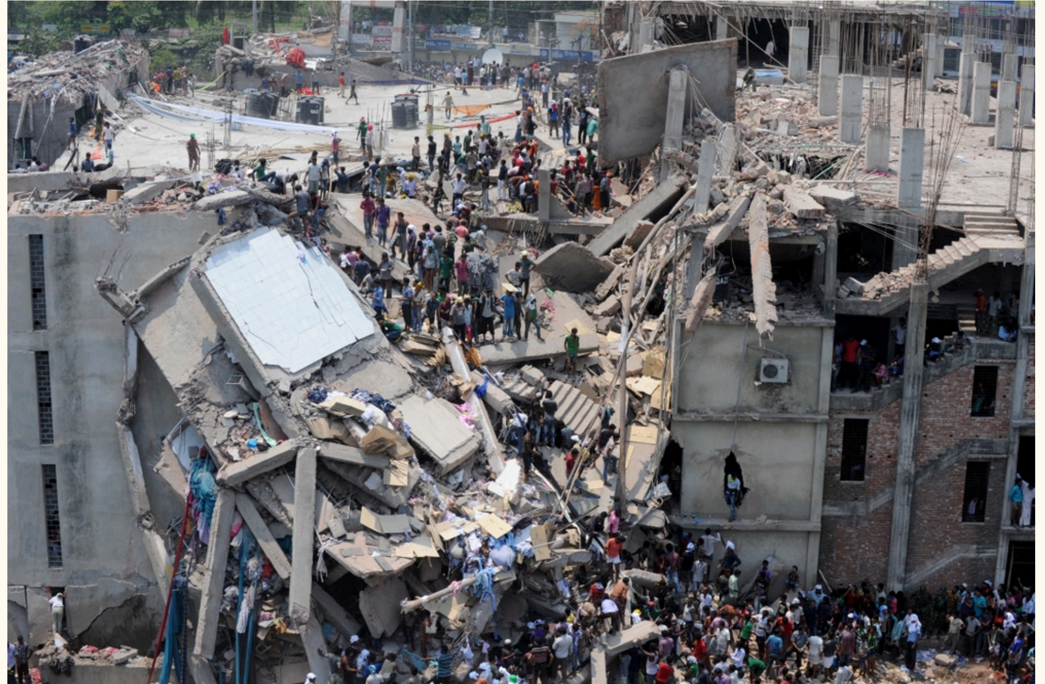
EFFONDREMENT DE L'USINE RANA PLAZA AU BANGLADESH, 2013